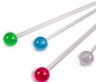
Коктейльная палочка с шариком

Попросите малыша поднять широкий язык за верхние зубы на бугорки (он уже это умеет делать). При этом ребенок «заводит мотор машины» — многократно проговаривает звук д – дддддддддд. В это время нужно подложить прямой правый указательный палец ребенка под кончик языка и начать производить частые колебательные движения справа налево от одного угла рта к другому (если ребенок левша – то левый). От этого будет слышаться рокочущий звук ддррррррррр. Мотор завелся, машина поехала и рычит ддрррррррр!